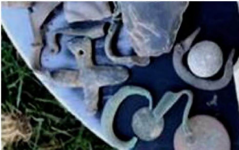
Рис. 9. Знахідки бронзові фібули, хрестик з отвором для підвішування, фрагмент пряжки, римські срібна та мідна монети III ст. н.е. на території черняхівського поселення № 5 поблизу с. Терешівці Хмельницького району