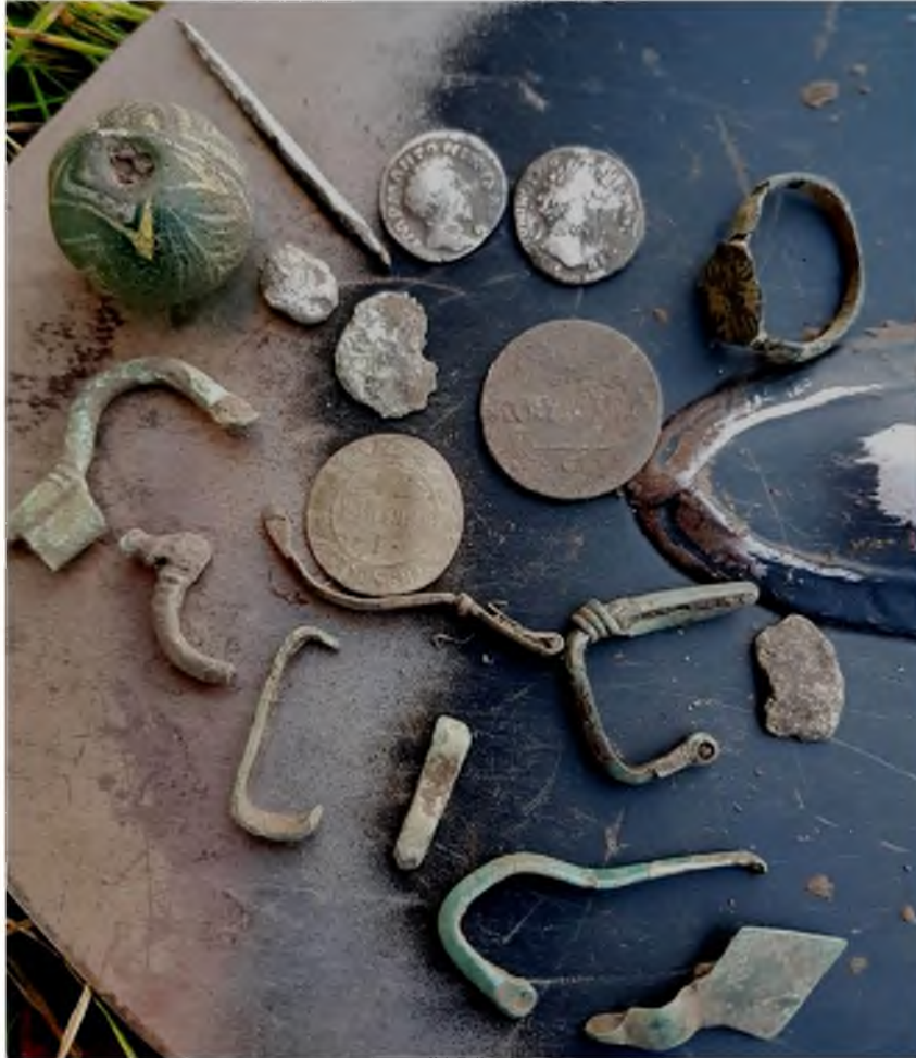
Рис. 10. Бронзові фібули, кусочки свинцю, римські денарії Марка Аврелія та Коммода, бронзове кільце із печаткою, скляна бусинка круглої форми з отвором, залізна проколка із черняхівського поселення № 6