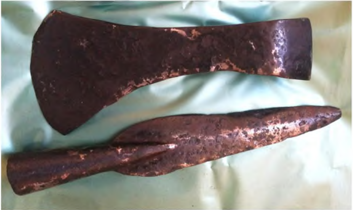
Рис. 6. Бойова залізна сокира та верхівка списа із черняхівського поселення № 3