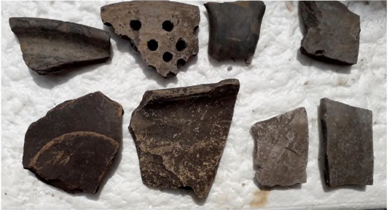
Рис. 11. Фрагменти гончарної кераміки (миски, глечика, горщика, друшлака) з черняхівського поселення № 5 за 3 км від с. Терешівці (2019 р.)