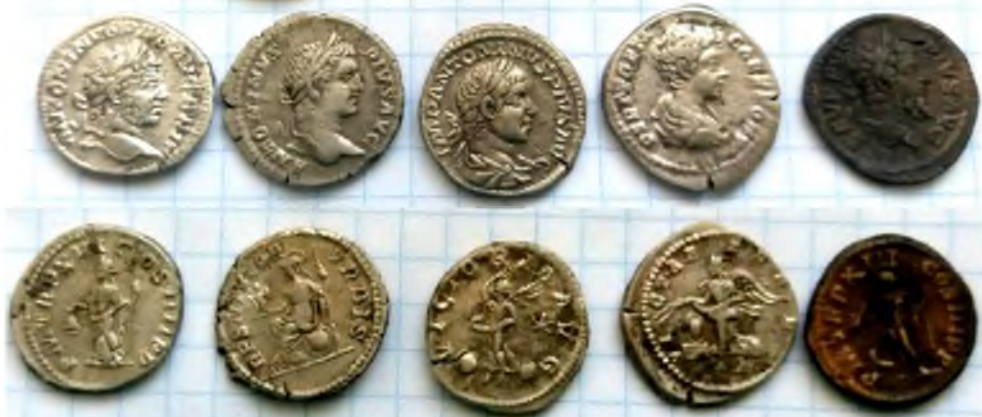
Рис. 16. Срібні денарії імператорів Каракали (211-217) - 1-3, Гетти (211- 212) - 4, Септимія Севера (244-249) – 5 з черняхівського поселення № 7