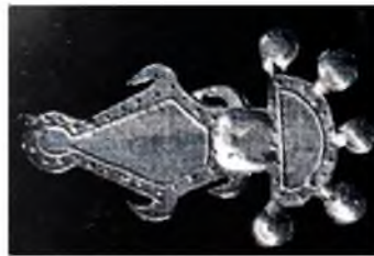
Рис. 4. П'ятиальчаста бронзова фібула із раньослов'янського городища V- початку VII ст. н.е., розміщеного за 1 км від західної країни с. Тершовець