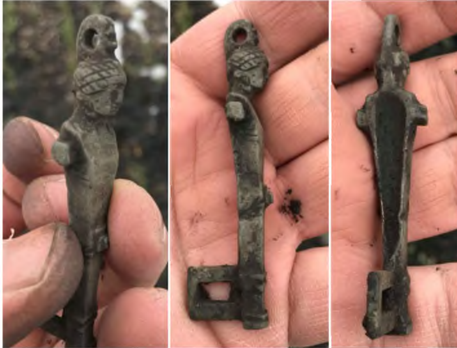
Рис. 3. Бронзова вставка до портупей римського легіонера з головою римської богині із черняхівського поселення, виявленої поблизу раньослов'янського городища V- початку VII ст. н. е.