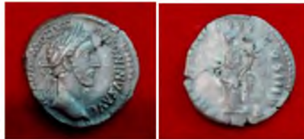
Рис. 18. Римська імперія, Коммод (180-196), денарій із черняхівського поселення № 8. Вага 2,1г, діаметр 18 мм. С. Терешівці Хмельницький р-н Хмельницької області, 2018 р.