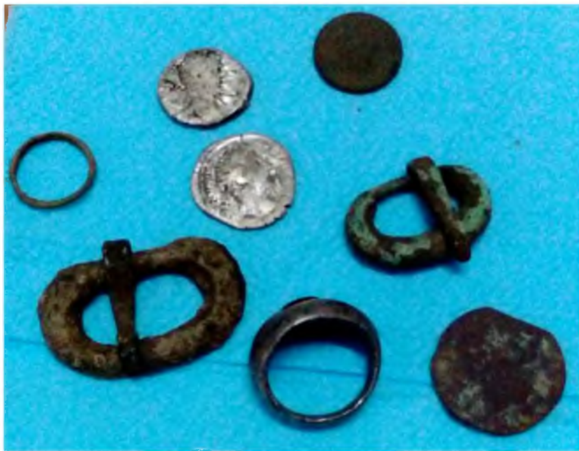
Рис. 14. Срібні денарії, перстень із червоним каменем, бронзові пряжки, кільце та дві монети з черняхівського № 7