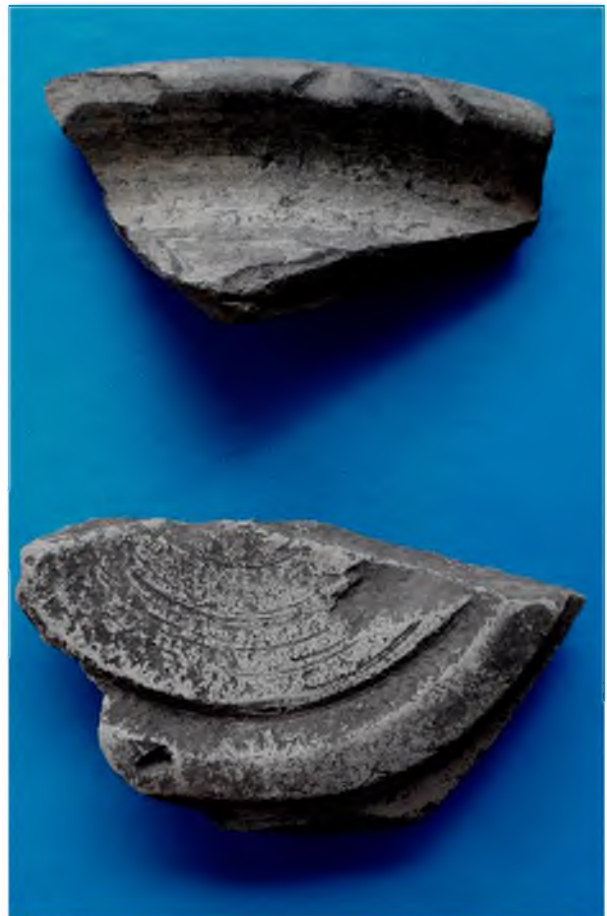
Рис. 12. Фрагменти гончарної сірої кераміки з черняхівського поселення № 6 за 3,5 км на схід від с. Терешівці (2019 р.)