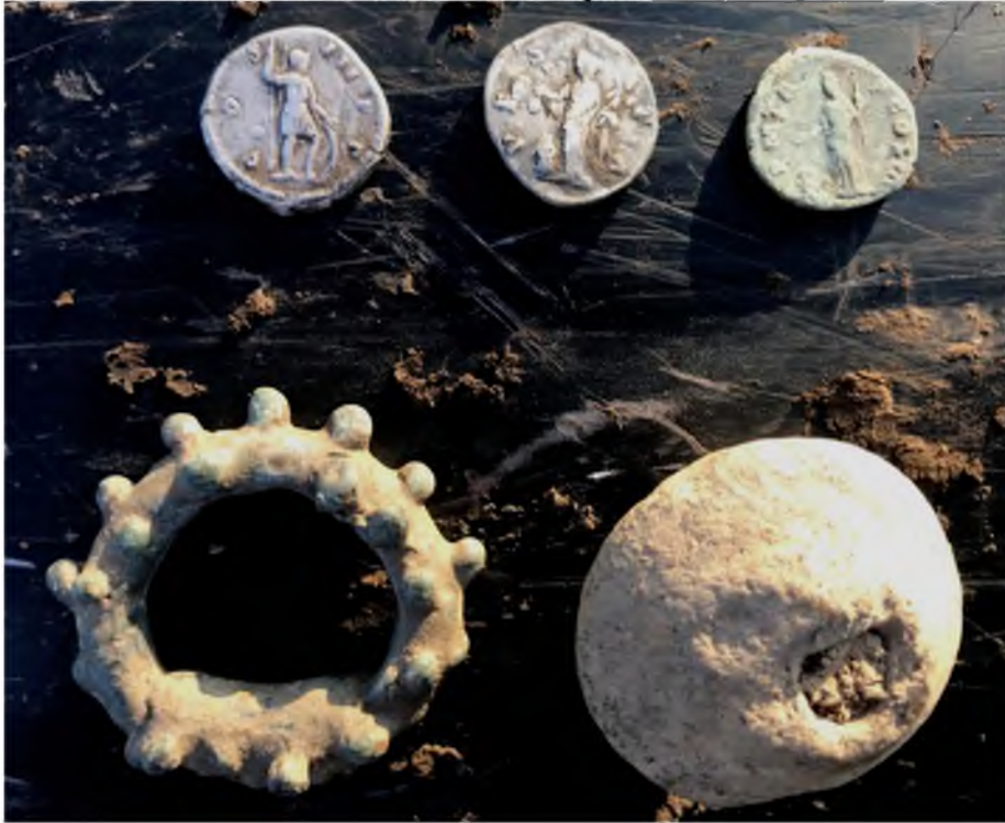
Рис. 8. Римські денарії II ст. н. е., бронзова прикраса круглої форми та керамічне прясельце із черняхівського поселення № 4