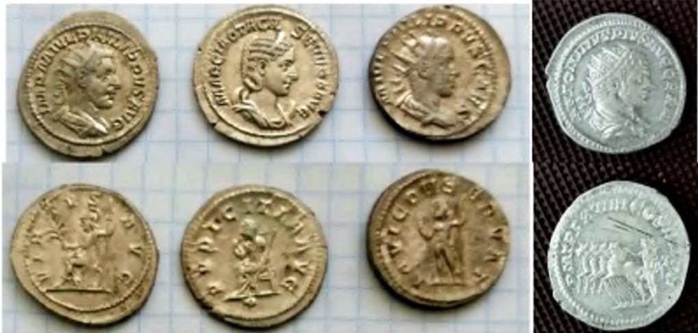
Рис. 17. Срібні антонініани, виявлені на черняхівському поселенні № 7: імператор Філіп I Араб - 1, 3, імператриця Отацилія Севера - 2, Каракалла (Марк Аврелій Антонін) (211-217) (Вага 5,01 г, діаметр 24 мм), 2019 р.