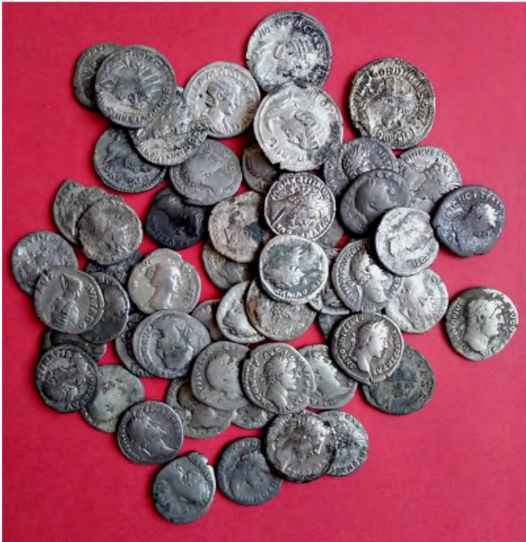
Рис. 15. Частина скарбу римських срібних денаріїв та антонініанів, знайдених на черняхівському поселенні № 7 поблизу р. Жилочки за 1,5 км на північ від с. Тершівці