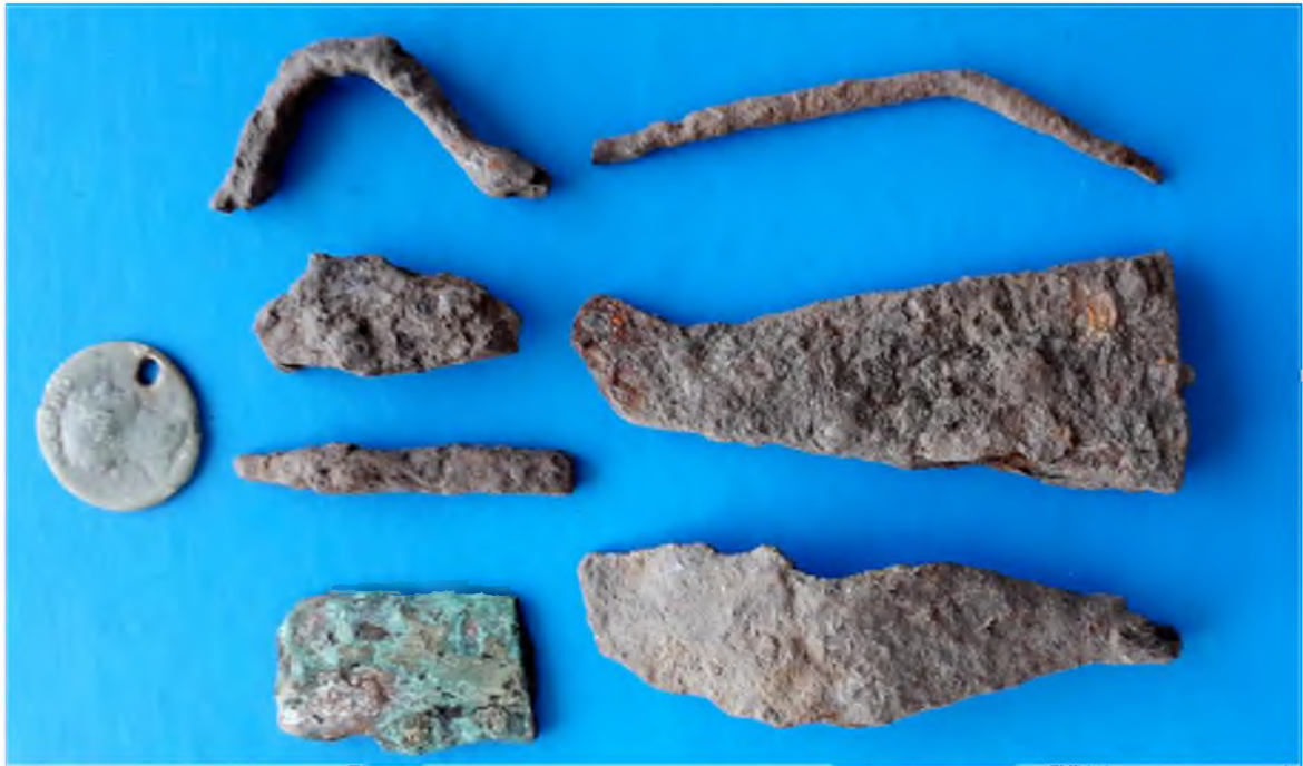
Рис. 13. Знахідки на черняхівському поселенні № 4 влітку 2019 р.: лемісний денарій імператора Траяна (98-117) з пробитим отвором; спинка залізної дугоподібної фібули; залізна проколка із тонким та товстим кінцями; залізний наконечник до стріли; бронзова пластинка – заготовка; частинка залізного ножа